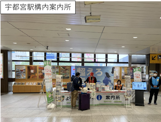
宇都宮駅構内案内所