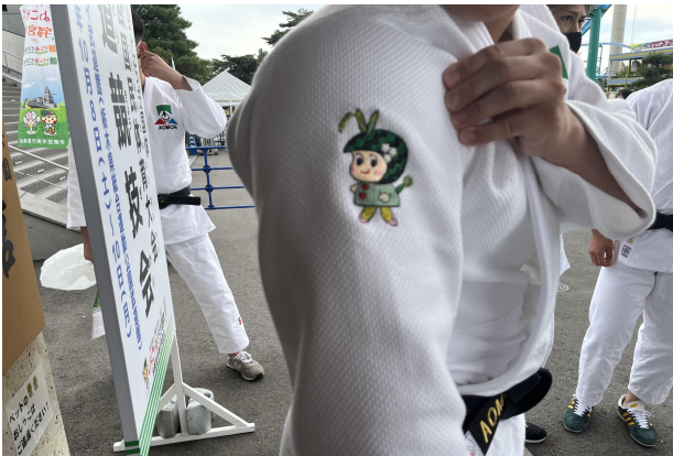
青森県代表柔道着（つがるちゃん刺繍）