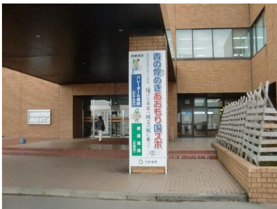
立看板：市役所正面玄関