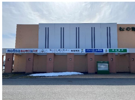
壁面看板：松の館正面