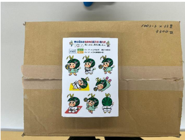
【キャラクターシール】