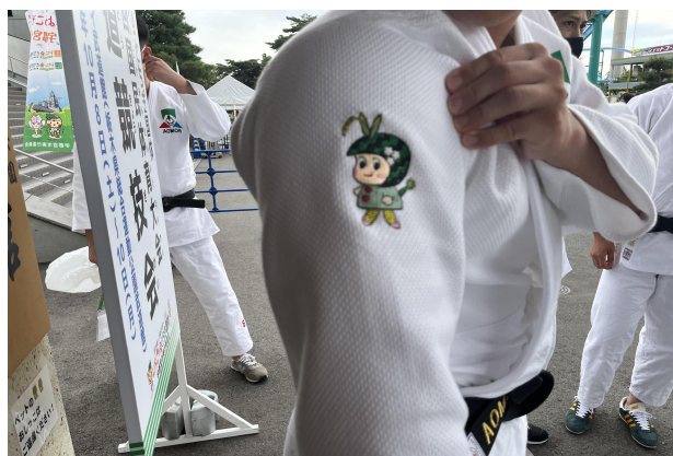
青森県代表柔道着（つがーるちゃん刺繍）