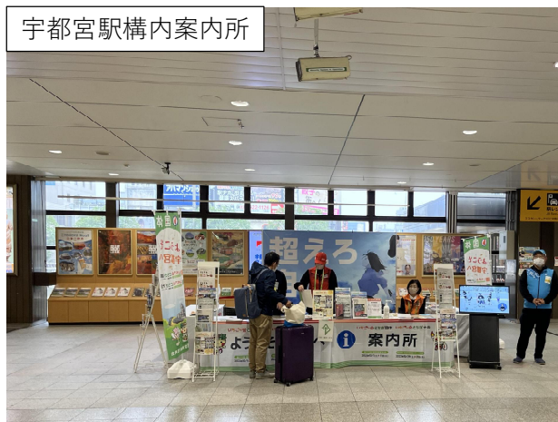
宇都宮駅構内案内所