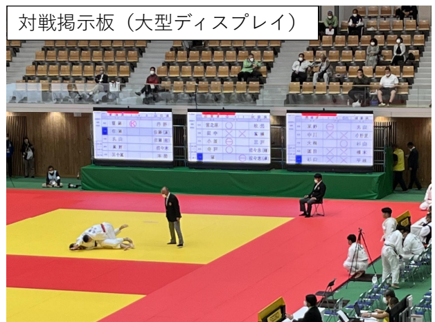
対戦掲示板（大型ディスプレイ）