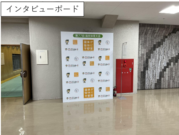
インタビューボード