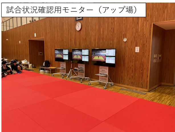
試合状況確認用モニター（アップ場）