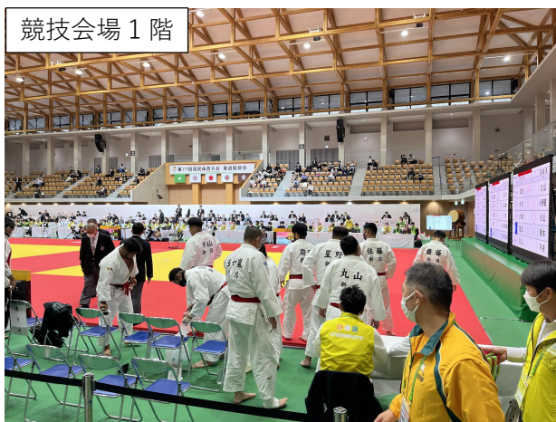
競技会場 1 階