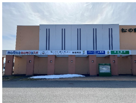
壁面看板：松の館正面