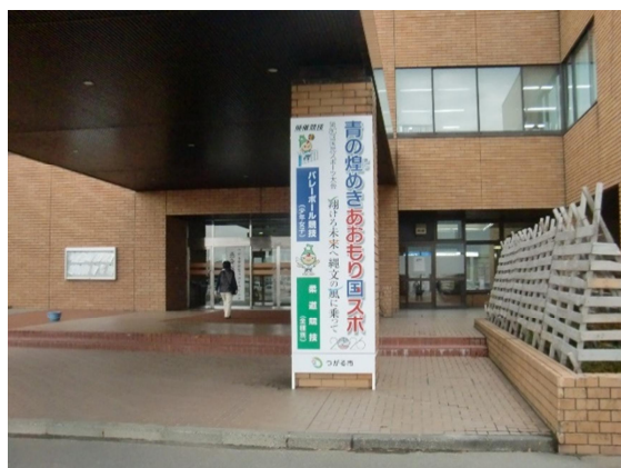
立看板：市役所正面玄関